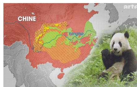
Carte de la Chine occidentale

Je vais parler pour ma part du panda dans ce travail. Le panda géant est une sorte d'ours de petite taille qui vit dans les montagnes de la Chine occidentale. Sa famille a un nom compliqué qui est Ailuropodidés.