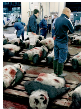
Massacre de pandas

Les chasseur veulent le tuer, car il y a beaucoup de personnes qui veulent cette fourrure. Mais maintenant, c'est un animal protégé. Les gens les massacrent pour les vendre.