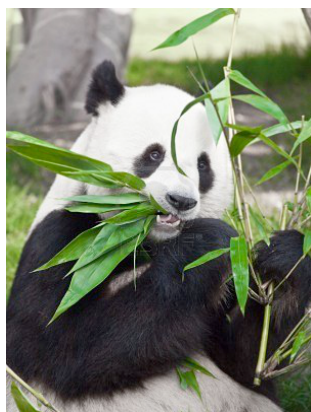
Panda qui mange

Le panda reste où il se trouve (où il vit), car il a exactement le besoin de nourriture qu'il lui faut. Il ne se nourrit presque que de feuilles et de jeunes pousses de bambous. Cette nourriture est peu nutritive et donc le panda doit, pour assurer sa subsistance, consacrer 10 à 12 heures par jour pour manger. Le panda géant mange aussi des gentianes, des crocus et des iris et parfois, il va capturer des petits animaux et du poisson. On voit que le panda n'est pas seulement un herbivore mais aussi un carnivore. Il mange selon les saisons plusieurs espèces de bambous. De novembre à mars, il mange généralement les feuilles et des jeunes tiges. D'avril à juin, des tiges plus âgées. De juillet à octobre, il ne mange que des feuilles. La forme de son corps est adaptée à son régime. Les muscles de la mastication sont renforcés grâce à sa grosse tête. Il a de grosses molaires, alors il peut bien mâcher la nourriture qui est assez dure.