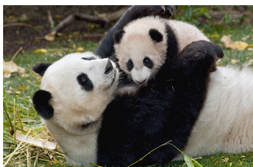
Pandas qui jouent

Peu après la naissance, la femelle lèche son petit 3 ou 4 heures par jour pour le laver. Quand elle veut l'emmener quelque part, elle le transporte en le tenant avec sa bouche ou avec ses pattes. Elle le berce contre sa poitrine comme nous, les humains. Elle va l'allaiter, car il n'est pas encore en âge d'être un herbivore. Quand le petit crie, elle le change de position et le rassure. Après la naissance, la mère ne quitte pas son abri, même pas pour se nourrir.