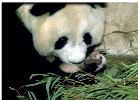
Maman avec son nouveau né.