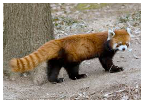
Un petit panda roux

1) Le panda roux, qu'on peut aussi appeler le petit panda. Il ressemble un peu à un gros chat roux.