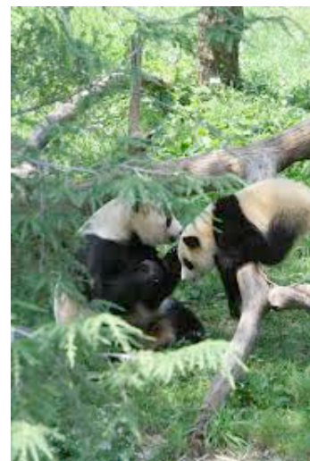
Pandas qui jouent

Le panda géant vit à l'état sauvage. Il vit dans les zones montagneuses et qui sont remplies de forêts en Chine. Il séjourne dans les forêts de bambous qui sont à une altitude située entre 1500 et 3300 mètres. Le panda ne peut pas passer partout, car les hommes s'installent et font des constructions. Les pandas ont peur de les approcher. Le panda géant se débrouille pour ne pas passer dans des villages, etc. Il vit dans des zones presque inaccessibles. Il ne vit pas en troupe (en clans). Le panda vit en solitaire.