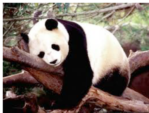
Sieste d'un panda

2) Il y a le panda géant qui ressemble à un ours. Il est blanc et noir, c'est un ursidé. Il est moyennement grand.