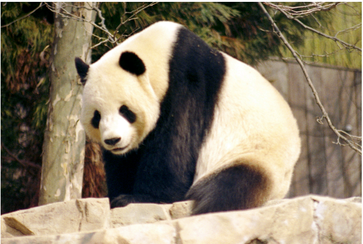
Un panda géant.